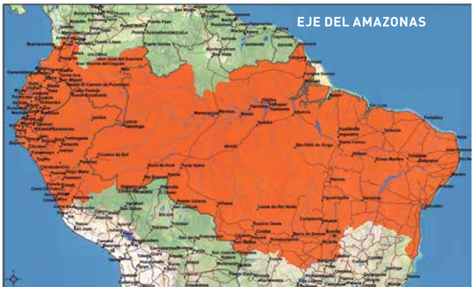
EJE DEL AMAZONAS

Definido a través de la delimitación de una región a lo largo del sistema multimodal de transportes, este eje vincula determinados puertos del Pacífico, como Buenaventura en Colombia, Esmeraldas en Ecuador y Pai-