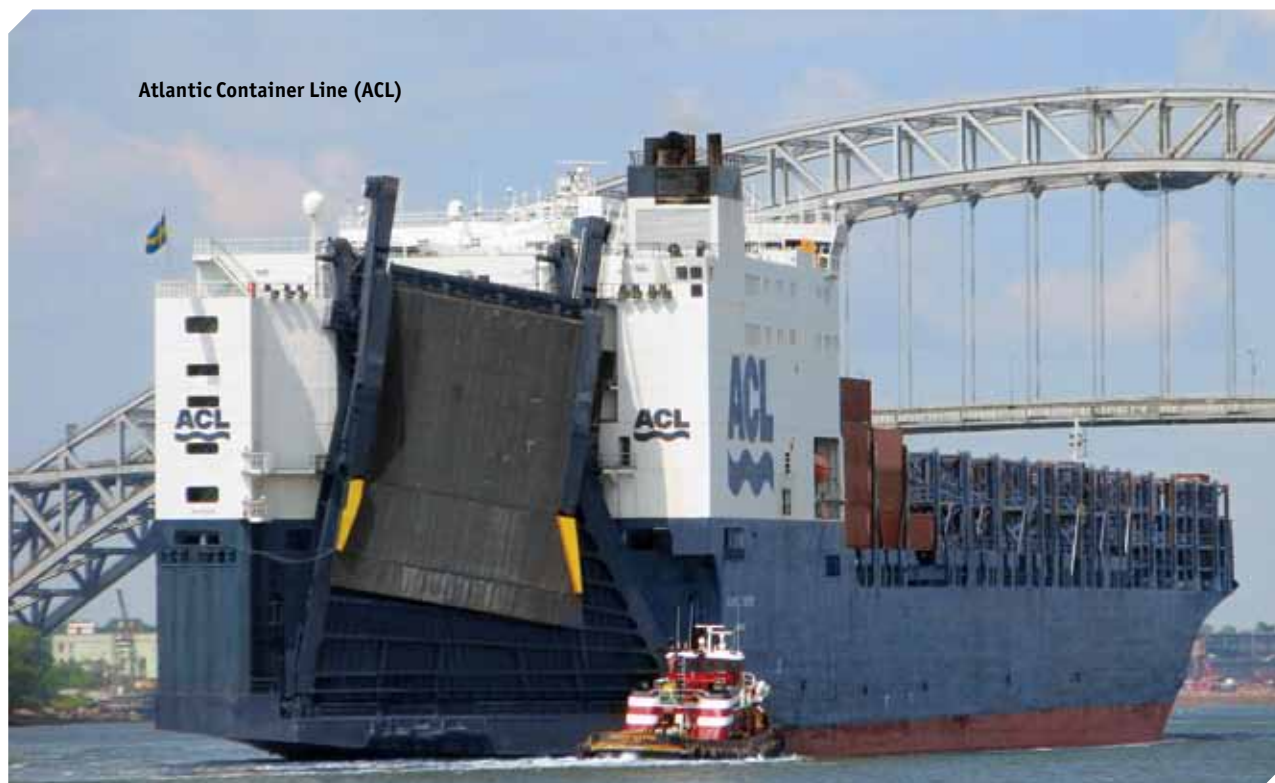
Atlantic Container Line (ACL)

APL es una empresa de transporte de contenedores global que ofrece más de 80 servicios semanales y 500 visitas en más de 140 puertos de todo el mundo. Combina las operaciones intermodales con tecnología de la información y comercio electrónico para proporcionar a los transportistas so-