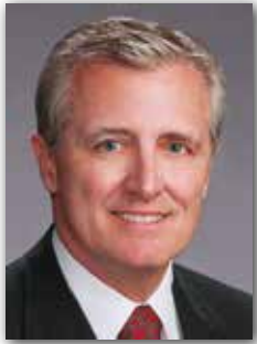
Leonard "Len" Waterworth Executive Director Port of Houston Authority

For nearly 100 years, the Port of Houston Authority has owned/operated the public cargo-handling facilities of the Port of Houston – the nation's largest port in terms of foreign waterborne tonnage. The port has historically been an economic engine for the Houston region, the state of Texas and the nation. The port contributes to the creation of more than one million statewide and more than 2.1 million nationwide jobs and the generation of more than $178.5 billion dollars of statewide and $499 billion dollars of nationwide economic activity.